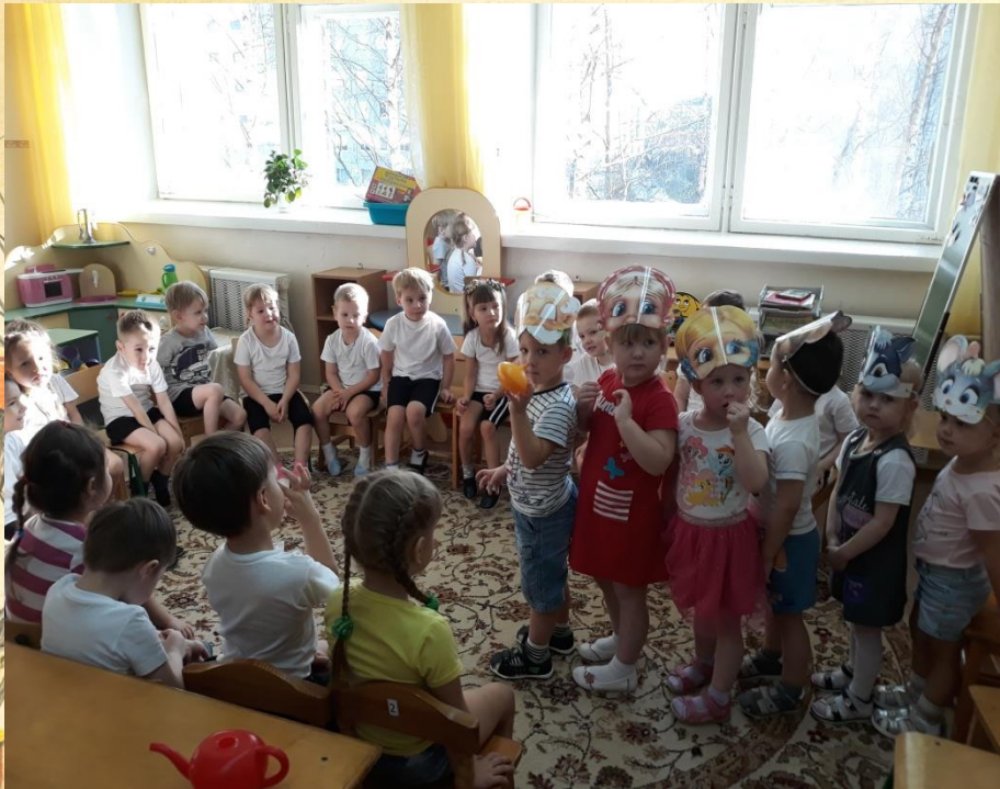
Фото выставка «Урожай на весь край!»